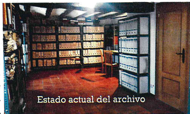
Estado actual del archivo

Se han colocado varias estanterías y unas mesas para consulta con la iluminación adecuada por lo que ya se pueden consultar los fondos de manera ordenada pidiendo cita previa.