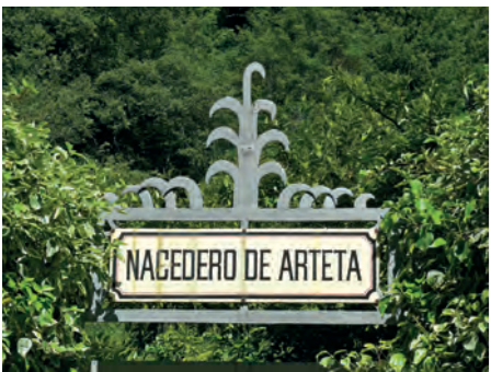
Entrada al manantial / Artetako Iturburu

Artetako iturburu edo sorburua kareharritzko paretan haiztarte ikusgarri baten irteeran dago. Andía mendilerroan dagoen akuifero edo ur geruza handiaren irteera natural bat da, eta haren batez besteko emaria segundoko 3.000 litrokoa da. Hornidura prozesu osoa Iruñerriko Mankomunitateak kudeatzen du. Iturburuaren sarreran, Ingurumen Informaziorako eta Heziketarako Zentroa dago (itxita dago behin-behinean, beste abisurik eman bitartean).