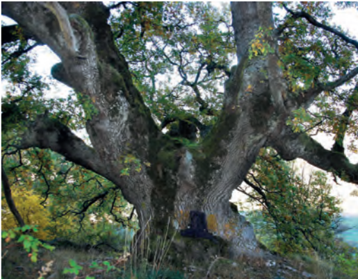
Roble trasmochó / Haritz lepatua