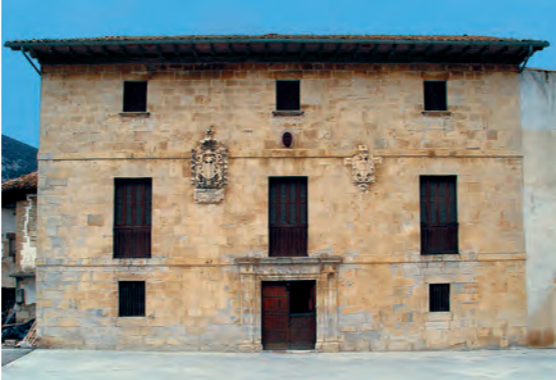
Casa Cerero, antiguo palacio (Olla) / Cerero etxea, jauregi izandakoa

ARKITEKTURA ZIBILA. Herri guztietan daude sekulako etxeak, landako arkitekturaren adibide ederrak. Hain zuzen, haietako asko XVIII. mendean eraikitakoak dira.