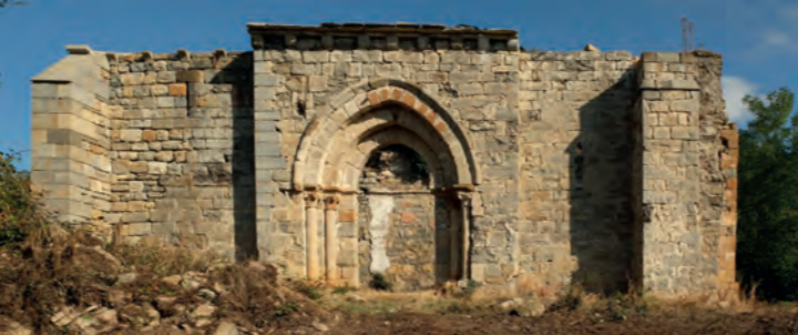
Ermita de Donamaria / Donamariako ermita

ELIZAK. Herrigune guztietan daude. Eraikin xumeak eta apalak dira, baina ongi zainduta daude eta itxura ederrekoak dira. Herrien eguneroko bizimoduan eragina izan dute.