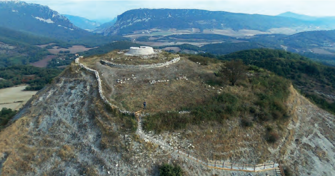
Vista aérea de Garaño / Garañoren airetiko ikuspegia

EL CASTILLO DE GARAÑO es una antigua fortaleza medieval del Reino de Navarra que corona un cerro estratégico a la entrada del valle. En los últimos años, las excavaciones están sacando a la luz imponentes vestigios de este patrimonio olvidado durante siglos. Las propias ruinas y la belleza de las vistas hacen muy recomendable la visita al lugar, a través de un agradable paseo.