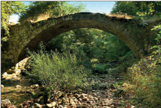
Puente medieval de Iltzarbe, sobre el río Udarbe. Iltzarbeko zubia, Erdi Arokoa, Udarbe errekararen gainean.

ARTETAKO GATZAGAK aspaldiko instalazioak dira, eta bertan tradizionalki gatza eskuratu izan dute, putzu batetik ateratzen den uretik. Gehienak utzita badaude ere, duela gutxi putzua bertu da eta esparruaren zati bat, eta bertan prozesua egiten da oraindik. Haietara iristeko modu erakargarriena da artetako iturburutik abiatzen den txango eder eta labor bat (Gatzagetako paseoa, 1,6 kilometro joan eta etorri), seinalezatuta dagoena.