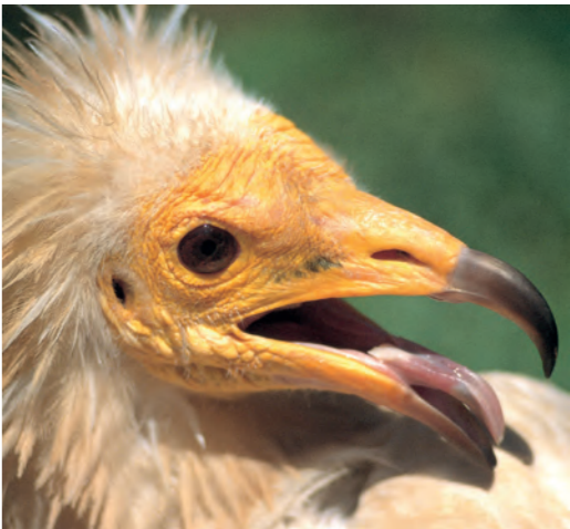
Alimoche / Sai zuria

El paisaje de Olla está dominado por montañas pobladas de bosques y pastos, con un fondo de valle cultivado en el que se asientan los pequeños pueblos. El medio natural actual es el resultado de la interacción humana secular. En los bosques, el uso humano ha dejado su huella en los grandes árboles trasmochos que hoy se pueden admirar. Los rasos de la sierra de Andía, pastoreados desde antiguo, eran el objetivo de los rebaños que llegaban por la cañada "Pasada de Olla"; una actividad, la ganadería extensiva, que pervive en la actualidad.