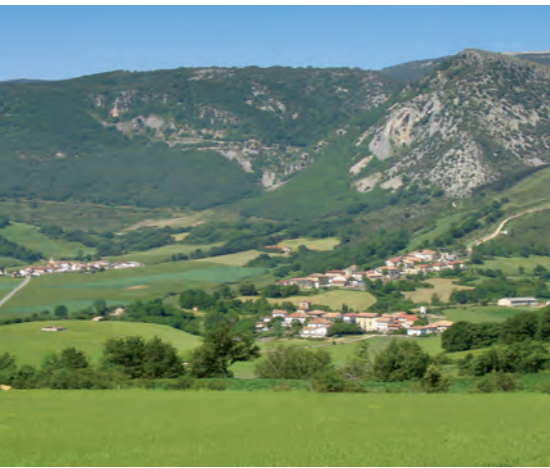
Arteta, Senosiain y Olla / Arteta, Senosiain eta Olla

Egillortik (1,9 km) edo Saldisetik (2,8 km) abiatuta, nahikoa da Ollarango Itzuliko bidea hartzea eta muinoaren azpiko leporaino iristea, seinaleei jarraitzea. Anozko zubitik ere seinalezatuta dago (1,9 km).