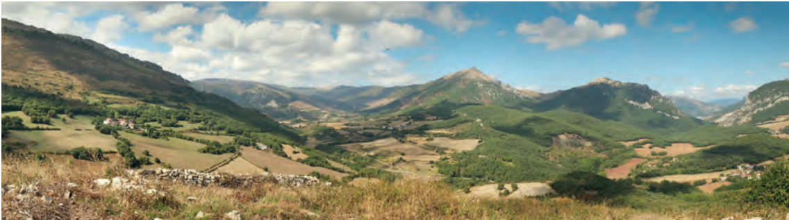
Val de Olla desde Garaño / Ollaran, Garañotik