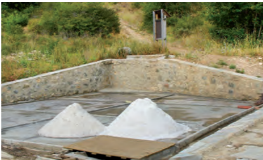
Saleras de Arteta / Artetako gatzagak